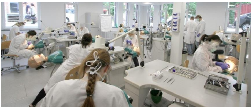
Phantomplätze in der Zahnklinik (Zwischenklinik – 5. und 6. Fachsemester)